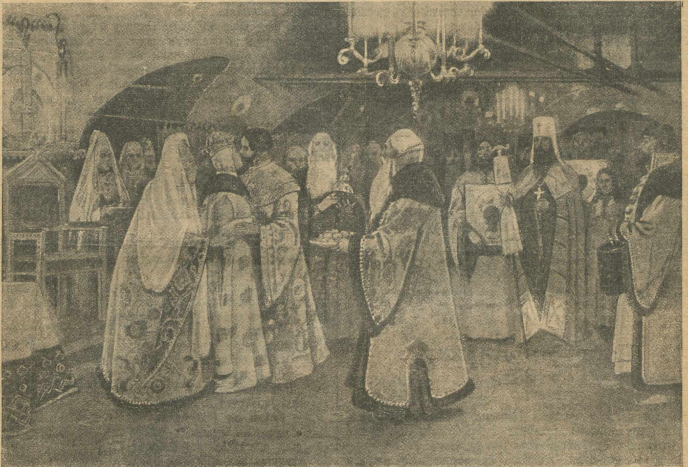
Свѣтлое Христово Воскресеніе въ царскихъ палатахъ Московскаго Кремля.

Государь шествовалъ къ обѣду въ Грановитую палату въ шубѣ, крытой серебряною парчей, въ сопровожденіи бояръ и другихъ лицъ, приглашенныхъ къ столу, и сѣдился на свое „Царское мѣсто“, (тронъ) за своей Царскій столъ помѣщавшійся въ переднемъ углу. По сторонамъ Царскаго мѣста, справа и слѣва, становились столы съ мечами, въ фезяхъ золотныхъ и шапкахъ по одному человѣку; поодаль отъ нихъ по два человѣка стрѣльцкихъ полковниковъ, безъ шапокъ. Столъ, кованный золотомъ и серебромъ, накры-